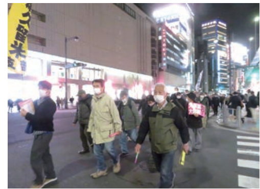
夜の街をデモ行進